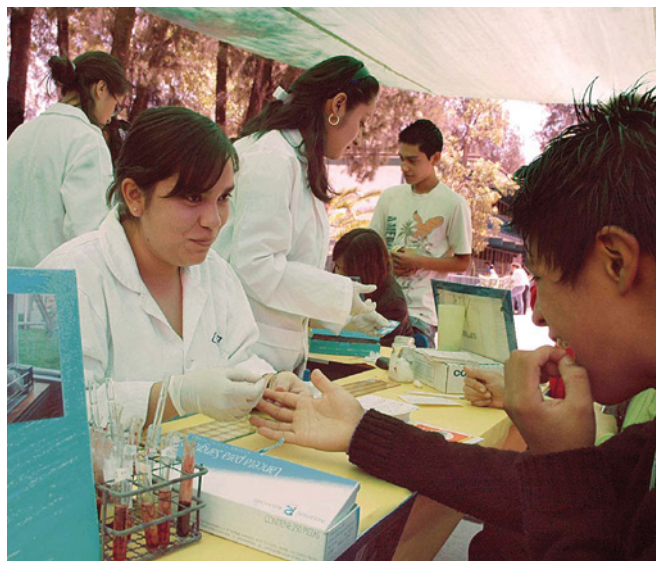
Opción Técnica Banco de sangre.