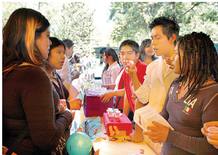
Opción Técnica Laboratorio Químico.