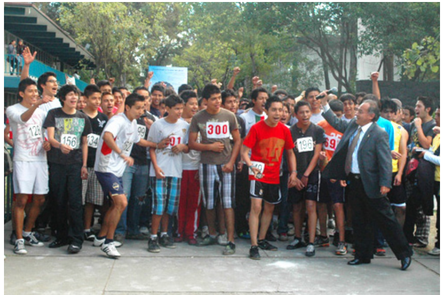
El inicio del reto por la gloria... y el pavo

Correr, trotar o caminar ayuda a conservar la salud, comentaban algunos competidores, previo al inicio de la tradicional “Carrera del pavo”, en su vigésima quinta edición. Y si de correr se trata para conservar la salud y estar en buena condición, mucho mejor; pero si se puede conquistar una ave, cuyo destino es servir como platillo de Navidad, corramos entonces con entusiasmo en esta fiesta y convivencia deportiva de fin de año, decían algunos más.