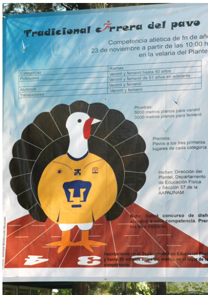
La succulenta invitación