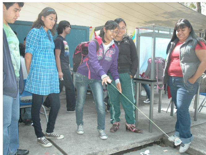
El juego como la base de un aprendizaje afectivo y ameno