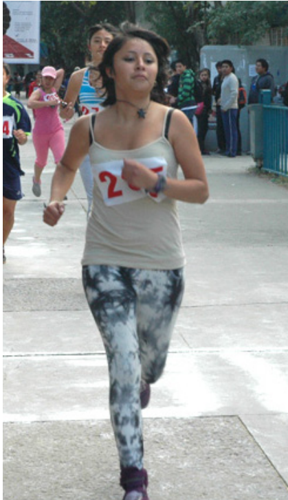
La llegada a la meta