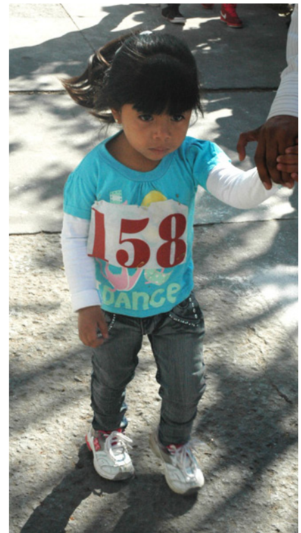
► 4 Para el deporte no existe la edad

La competencia no fue sencilla, pues se observaban rostros sudorosos, con muecas de dolor, por el esfuerzo realizado en esta justa que hermana a la comunidad cecehachera y que marca el inicio de la maratónica festividad por la llegada de la Navidad y el año nuevo.