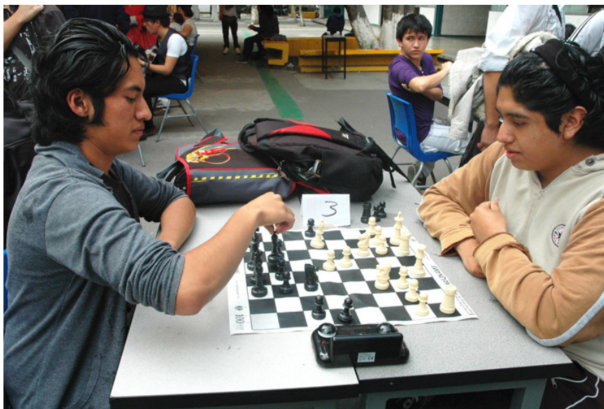
Momentos de concentración y decisión

D icen que el tiempo libre es uno de los tesoros más bellos que nos da la vida; en contraparte se señala que el ocio es “la madre de todos los vicios”. ¿Entonces, por cuál decidimos en un espacio académico como el nuestro?