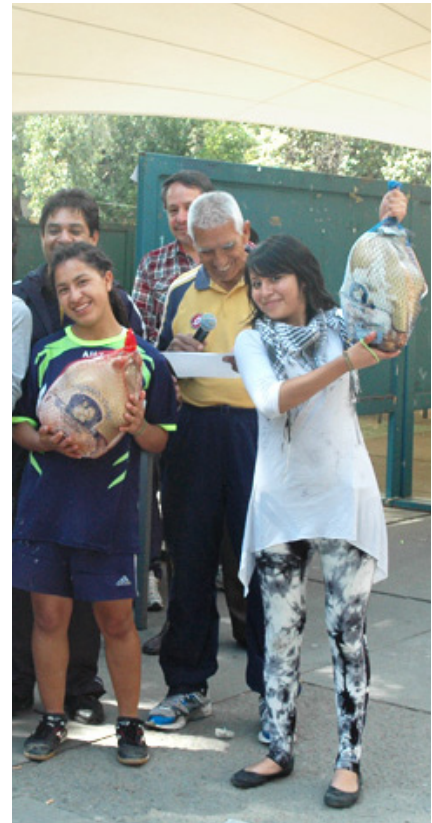
El merecido premio

Cabe destacar que antes y durante la competencia y la premiación, los profesores del Departamento de Educación Física se encargaron de toda la logística, fungieron como jueces y también como animadores de esta tradicional carrera. ♀