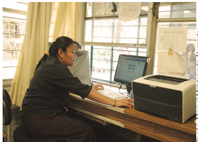
Diseño: Marisol Maldonado Alvarado