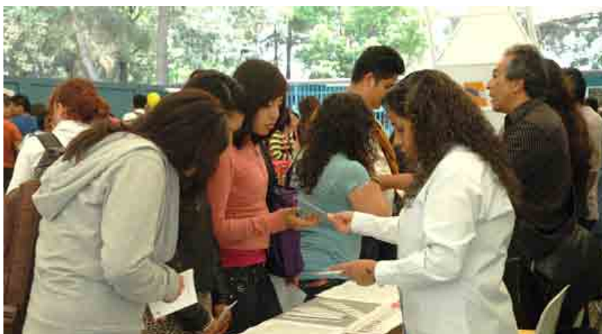
Interés y curiosidad, la constante del evento